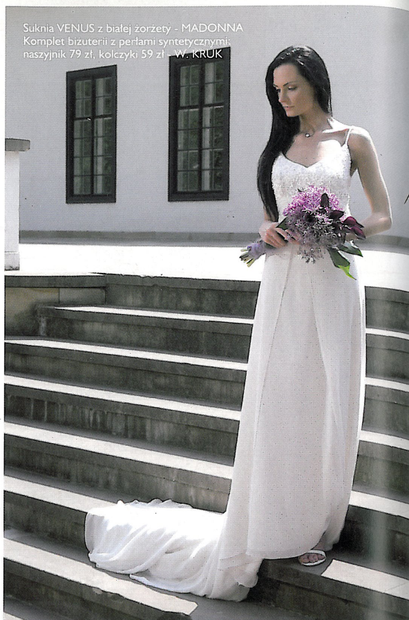
Suknia VENUS z białej żorżety - MADONNA Komplet biżuterii z perłami syntetycznymi: naszyjnik 79 zł, kolczyki 59 zł - W. KRUK