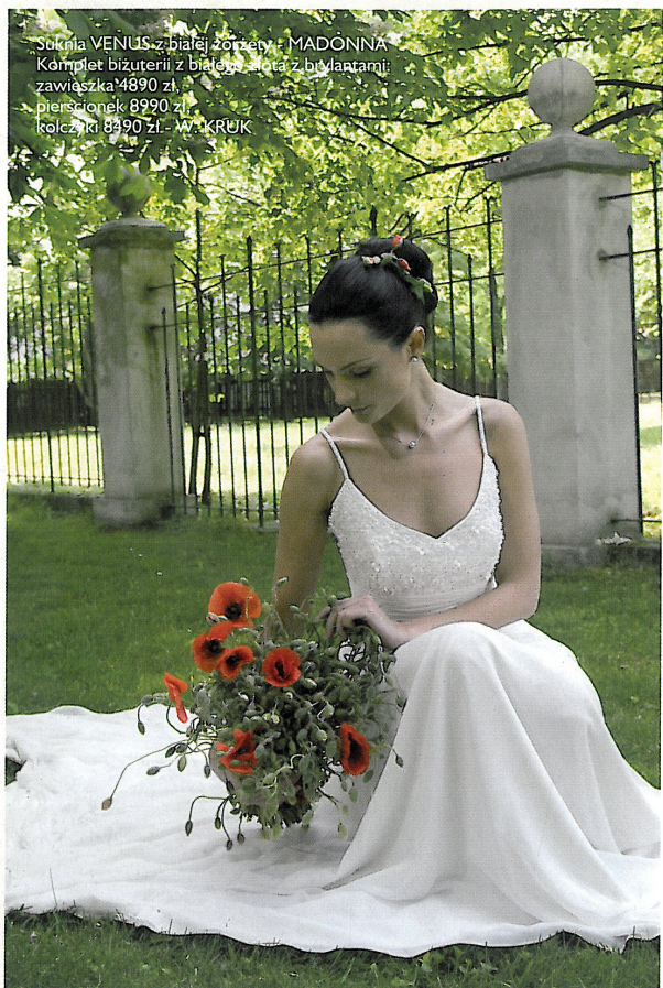
Suknia VENUS z białej żorżety - MADONNA Komplet biżuterii z białego złota z brylantami: zawieszka 4890 zł, pierścionek 8990 zł, kolczyki 8890 zł - W. KRUK