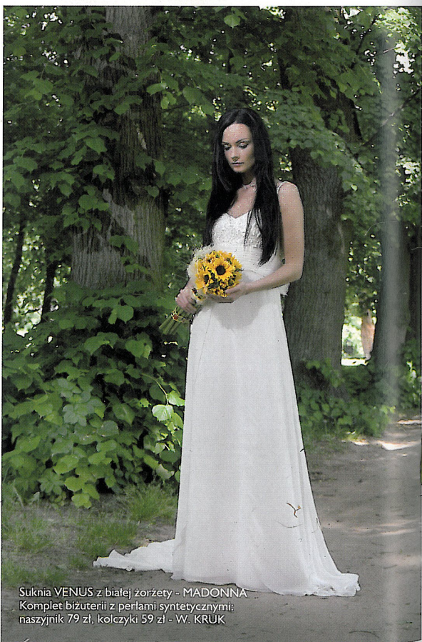
Suknia VENUS z białej żorżety - MADONNA Komplet biżuterii z perłami syntetycznymi: naszyjnik 79 zł, kolczyki 59 zł - W. KRUK