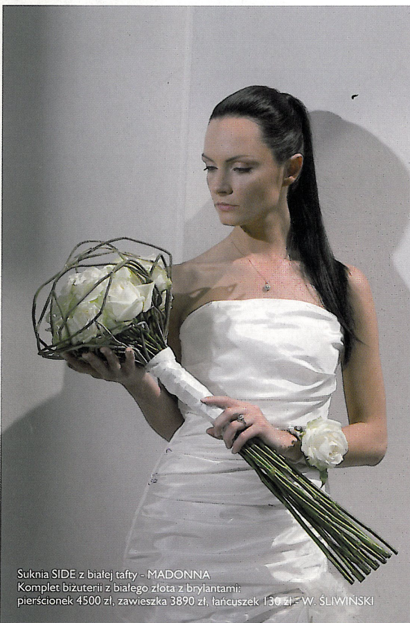
Suknia SIDE z białej tafty - MADONNA Komplet biżuterii z białego złota z brylantami: pierścionek 4500 zł, zawieszka 3890 zł, łańcuszek 130 zł - W. ŚLIWIŃSKI